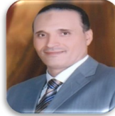
محمد لطفى السيد